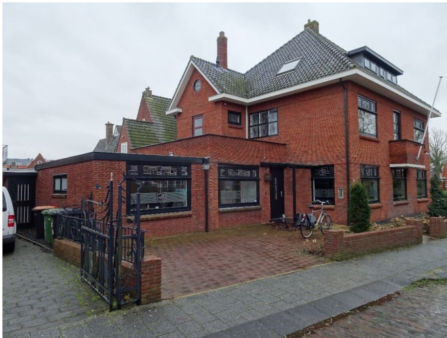
Afbeelding 3. Kantoorpand vanuit het zuidwesten.